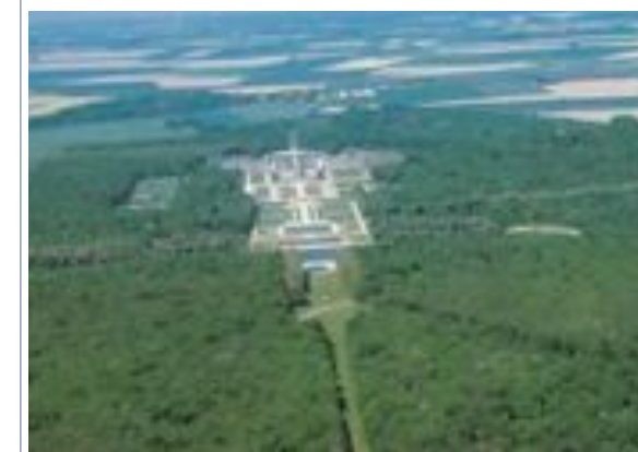
Vue aérienne contemporaine.

Le jeune roi Louis XIV (il a alors tout juste 23 ans) prit ombrage de toute cette magnificence qui est l'une des raisons de l'arrestation et de la chute irrémédiable du surintendant Nicolas Fouquet. M. B.-A.