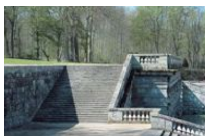
Vue sur l'ensemble des jardins depuis la terrasse. L'escalier mène à cette terrasse située au-dessus des grottes et au bassin « la Gerbe ». Au-dessus, sur le point le plus haut des jardins, domine la statue d'Hercule.

De très nombreuses gravures d'Israël Silvestre témoignent de l'aspect du parc à l'époque de Fouquet.