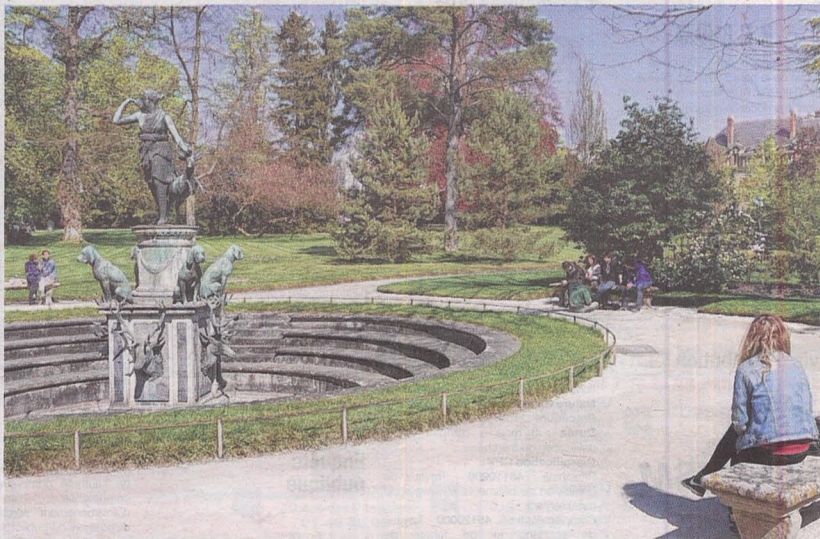
Fontainebleau, mercredi. Cet espace paysager remarquable se distingue notamment grâce à sa fontaine dédiée à la déesse romaine de la chasse, réalisée en 1603 par le sculpteur Francini.

L'aspect paysager du jardin, dit « anglais », date de Napoléon I er et de Louis-Philippe, avec ses plantations de rhododendrons dont les massifs viennent d'être refaits. « Nous avons retrouvé la liste des végétaux présents en 1814, grâce à des documents écrits par l'architecte du palais de l'époque, Maximilien Joseph Hurtault. On y trouve no-