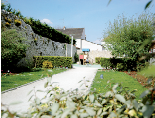
Jardin du square de la Grenouillère