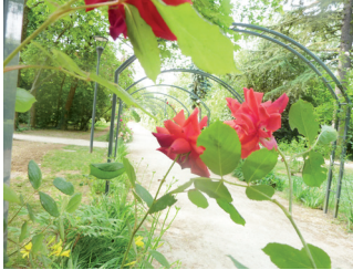
Jardin des Bienfaites