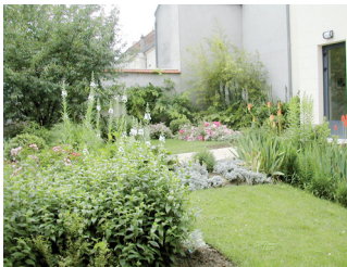
Jardin de la Médiathèque