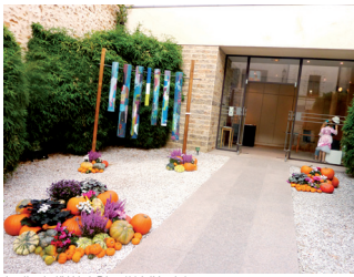
Jardin de l'Hôtel-Dieu (Médiévale)