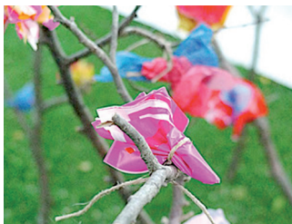
© «Plastique Land» - Marie-Laure Bruneau

Documentaire « Waste Land » de Lucy Walker - Oscar 2011 À partir de 10 ans