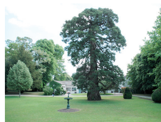
Jardin de la Mairie

[X-tazyk] propose depuis 2006 une musique mélangeant trash et métal alternatif. Le groupe issu des studios de répétitions de la ville, a récemment sorti un EP intitulé « Initial Insanity »!