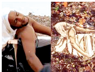
© Waste Land - Vic Muniz, photographie