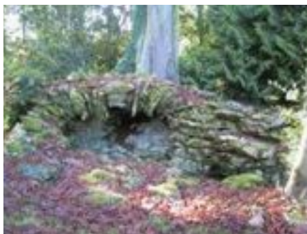
Le jardin anglais aménagé au cours du XVIII e siècle s'orne de variétés d'arbres diverses : platanes, pins, cyprès, tulipiers, séquoias...

C'est en mai 1609, sous le règne d'Henri IV, que la mise en eau du canal eut lieu ; placé en 1866 L'Aigle défendant sa proie par Cain.