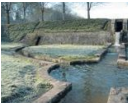
Ci-dessus, le deversoir à l'extrémité du grand canal.

C'est en mai 1609, sous le règne d'Henri IV, que la mise en eau du canal eut lieu ; placé en 1866 L'Aigle défendant sa proie par Cain.