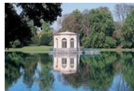
Le pavillon au milieu de l'étang a été construit sous Louis XIV par Le Vau. Des soupers y étaient organisés et sur l'étang, joutes nautiques et feux d'artifice.

Cette histoire, ces inventions marquent une étape essentielle dans la mise au point du jardin français classique et donnent au parc de Fontainebleau son caractère le plus remarquable ; un parc qui a beaucoup évolué, où les styles se sont succédé pour aboutir aujourd'hui à un mélange de genres qui répond à celui du château. C'est Le Nôtre qui a donné l'exemple de la radicalité et de la non-soumission au style en place, en remaniant presque totalement les premiers jardins, apparus comme révolutionnaires en leur temps, cadre de l'éclosion intellectuelle et artistique de la Renaissance. Des modifications multiples seront entreprises jusqu'à la fin du XIX e siècle, avec la mode des jardins anglais qui touchera entre autres le jardin des pins qui avait eu la faveur de Catherine de Médicis. Le parc actuel est le résultat de ces apports et transformations ininterrompus, liés à la passion de propriétaires successifs avec, au final, le charme d'une œuvre habitée par l'histoire ; une œuvre qui est en même temps un jalon essentiel dans l'histoire des jardins. B. D.