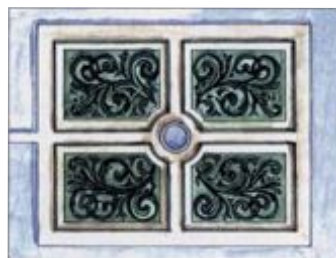
Parterre du château dessiné par Claude Mollet.